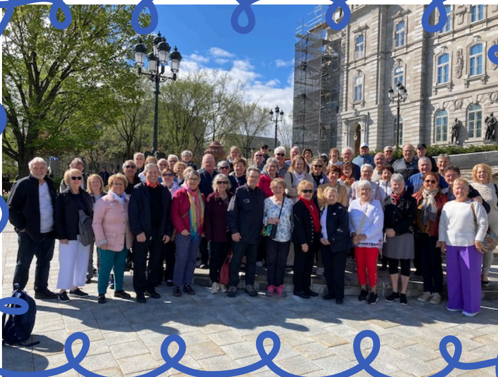
Plusieurs membres qui ont pris part à la sortie au parlement